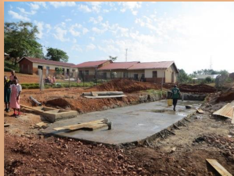
120m³ Zisterne & Wasseraufbereitung an der Grundschule KISA