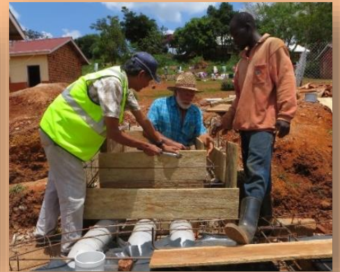
Solarprojekte und Hygieneprogramme an den Krankenhäusern in Bugema & Ishaka