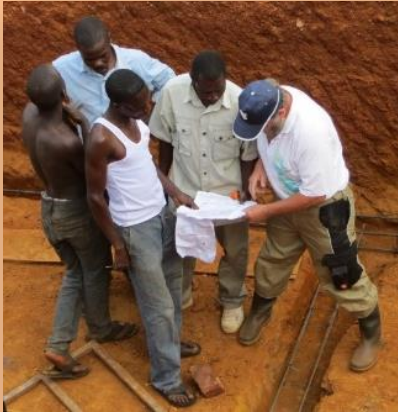
König-Konrad Preis der Stadt Weilburg