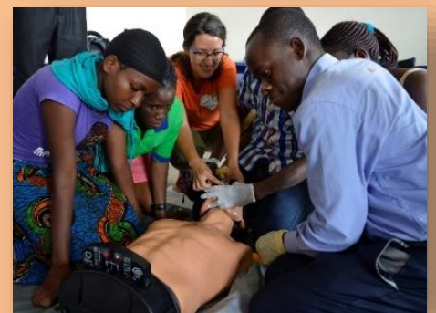
eFAST und POC – Ultraschalltraining